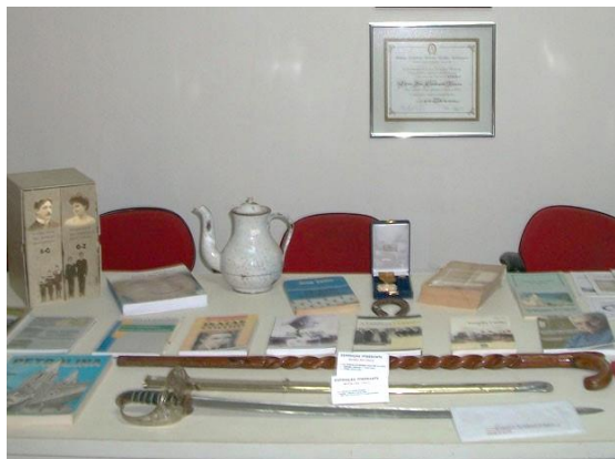
Portal G1, 29/11/2023

Entre o 2º semestre de 2013 até janeiro de 2014, uma exposição em homenagem aos 300 anos do fundador do povoado de Caboclo, no Sertão de Pernambuco, no município de Afrânio. O acervo, distribuído pelo Museu do Pai Chico, é composto por vários objetos pessoais, como um bule de louça, uma bengala, livros, fotografias de arquivos, desenhos, diploma, medalha, broche e selos.